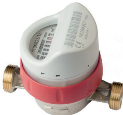
Lämminvesimittari LVI 4438 023