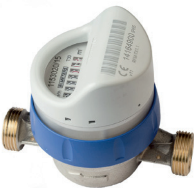
Kylmävesimittari LVI 4418 032

E-1 keskus LVI 4482 621 Langaton vahvistin LVI 4482 622