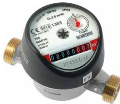
Lämminvesimittari LVI 4438 010