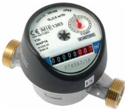
Kylmävesimittari LVI 4418 010