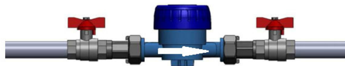
Kuva 1. Esimerkki asennuksesta