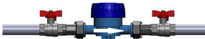
Kuva 1. Esimerkki asennuksesta