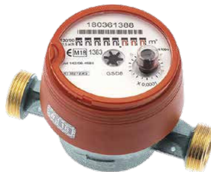
Lämminvesimittari LVI 4438 021