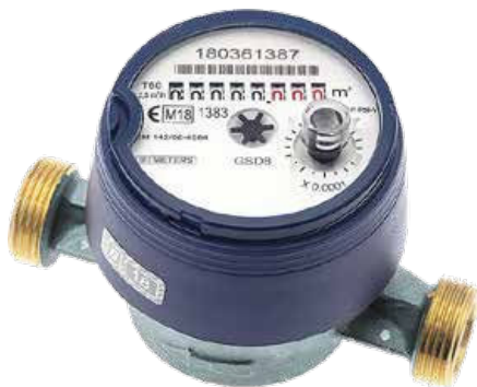
Kylmävesimittari LVI 4418 021